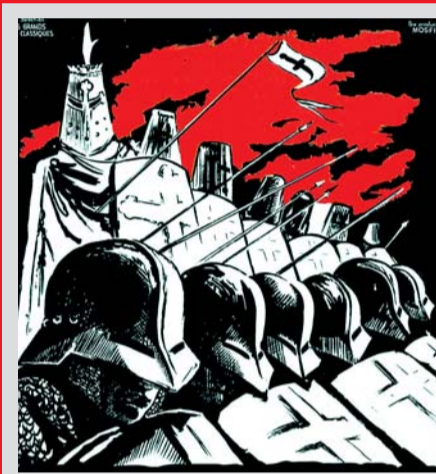
1420 Überfall deutscher Truppen unter König Sigismund, (Schlacht am Vítkov-Berg) gegen die Hussiten