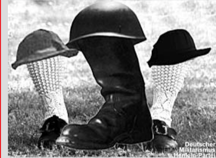
1938/39 Münchner Diktat – Annexion Böhmen und Mähren - 15. März 1939 Einmarsch der deutschen Wehrmacht in Prag